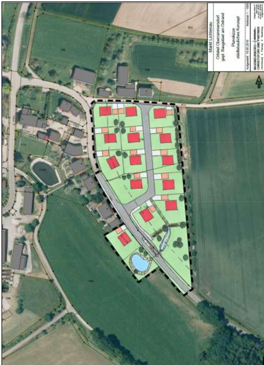
Konzeptskizze mit mögliche Siedlungsentwicklung vom 16.05.2019

Die Aufstellung des Bebauungsplans erfolgt im beschleunigten Verfahren gem. § 13b BauGB über die Einbeziehung von Außenbereichsflächen. Mit dem Planungsgebiet wird eine Grundfläche von weniger als 10.000 m 2 Grundfläche im Sinne des § 13a Absatz 1 Satz 2 BauGB für Wohnbauflächen begründet. Das Planungsgebiet schließt an den im Zusammenhang bebauten Ortsteil von Oberrammersdorf an. Die Voraussetzungen zur Aufstellung des Bebauungsplans gem. § 13b BauGB sind somit gegeben. Es wird darauf hingewiesen, dass gem. § 13b BauGB i.V.m § 13a Absatz 3 Nr. 1 BauGB die Aufstellung des Bebauungsplans ohne Durchführung einer Umweltprüfung gem. § 2 Abs. 4 BauGB durchgeführt wird.