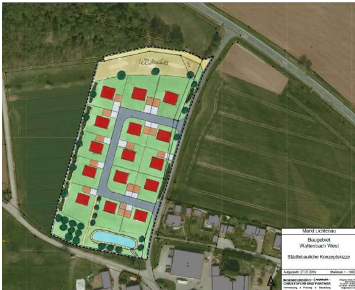
Konzeptskizze mit Darstellung mögliche Siedlungsentwicklung vom 27.07.2019

Die Aufstellung des Bebauungsplans erfolgt im beschleunigten Verfahren gem. § 13b BauGB über die Einbeziehung von Außenbereichsflächen. Mit dem Planungsgebiet wird eine Grundfläche von weniger als 10.000 m 2 Grundfläche im Sinne des § 13a Absatz 1 Satz 2 BauGB für Wohnbauflächen begründet. Das Planungsgebiet schließt an den im Zusammenhang bebauten Ortsteil von Wattenbach an. Die Voraussetzungen zur Aufstellung des Bebauungsplans gem. § 13b BauGB sind somit gegeben.