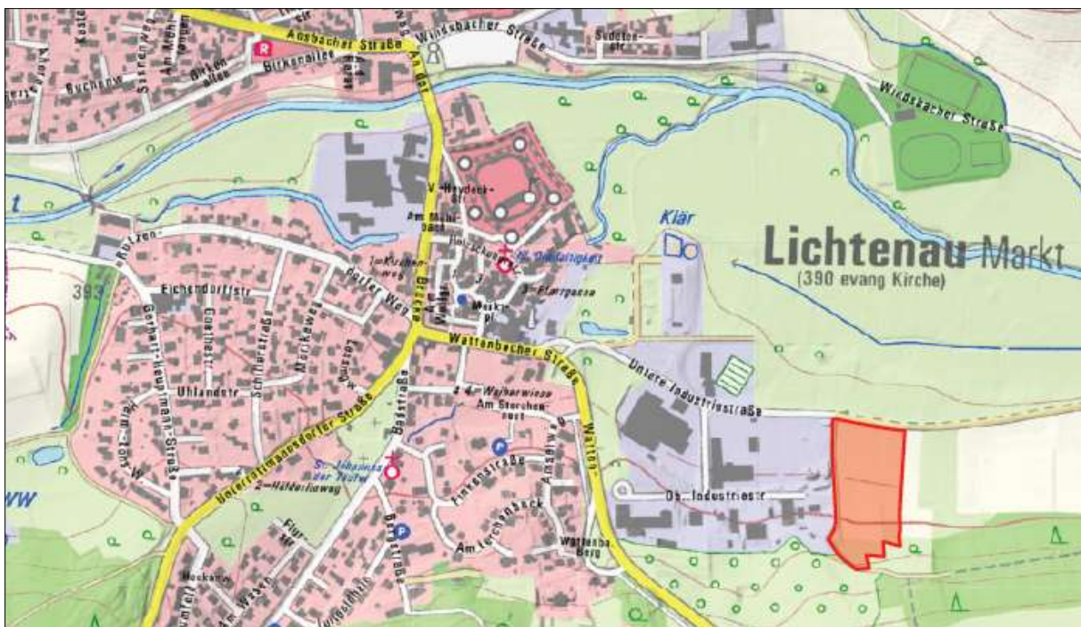
© Kartendarstellung: Bayerische Vermessungsverwaltung 2020; Rot gekennzeichnet: Planungsgebiet

Der Geltungsbereich des Bebauungsplans Nr. 9B liegt am östlichen Rand des bestehenden Gewerbegebiets von Lichtenau. In das Planungsgebiet wurden bisher als landwirtschaftliche Flächen genutzte Bereiche im Osten von Lichtenau südlich der Unteren Industriestraße einbezogen. Zum Zeitpunkt dieser Bekanntmachung sind folgende Flurstücke Bestandteil des Geltungsbereiches, Flurnummern 292, 293, 296 und 415/76 jeweils der Gemarkung Lichtenau. Die Gesamtfläche des Planungsgebietes beträgt ca. 2,0 ha.